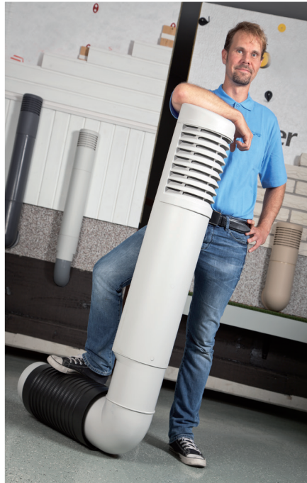
Extra grote luchtdoorlaat met het grootste model Ross ventilatieschacht van \varnothing 200\text{mm} !

De Ross ventilatieschacht is ontworpen voor toepassing in zowel nieuwe gebouwen als bij renovaties. In oude gebouwen kan worden aangesloten op bestaande kanalen of roosters. De ventilatieschacht maakt een betere ventilatie mogelijk omdat de opening zich ruim boven maaiveld bevindt.