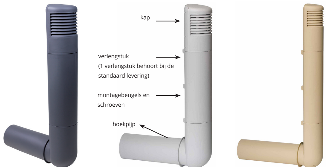
Ross ø 160mm donkergrijs